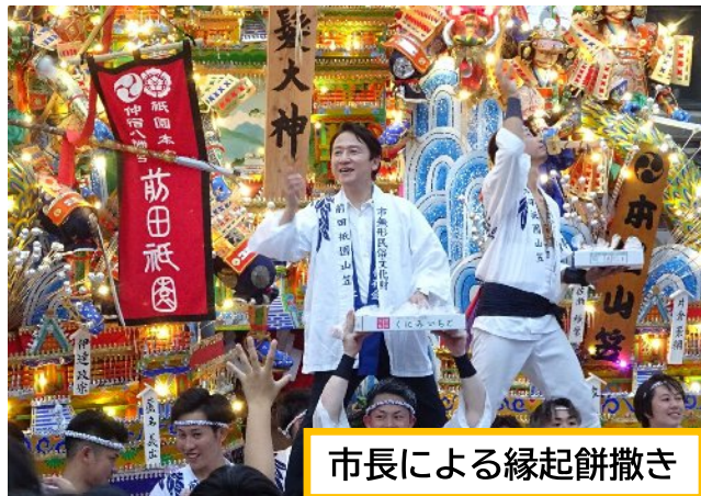
市長による縁起餅撒き