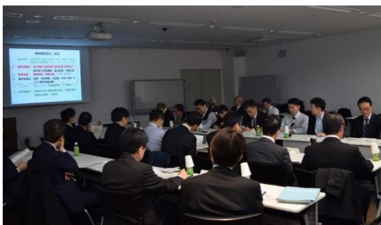
F A I N の定例研究会の様子