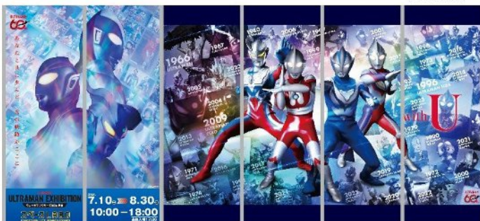
図1 スペース LABO 正面の撮影スポット(イメージ)