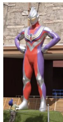
ウルトラマンティガ像(イメージ)

ジ アウトレット北九州タイアップ企画の詳細は 右のジ アウトレット北九州の掲載ページへの リンク(QR コード)をご参照ください。➡