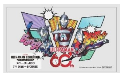
図2 特典イメージ (左)特製ステッカーA (上)特製ステッカーB