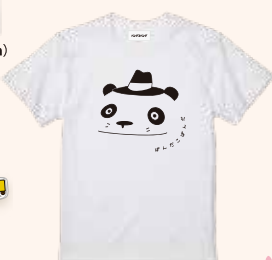
Tシャツ (S/M/L) 各3,300円(税込)