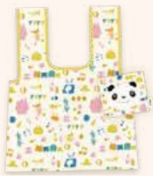
エコバッグ 1,760円(税込)