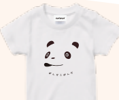
Tシャツ (110/130cm) 各3,190円(税込)