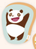
ダイカットクッション 3,080円(税込)