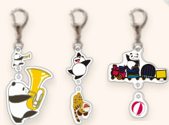
2連アクリルキーホルダー 各880円(税込)