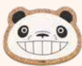
コルクコースター 660円(税込)