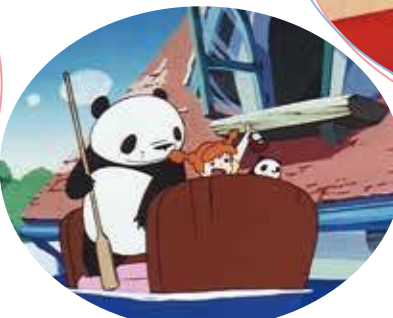
「雨ふりサーカスの巻」場面写 演出：高畑勲 原案・脚本・画面設定：宮崎駿