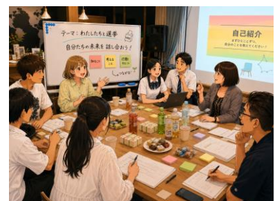
※画像は AI で作成したイメージです