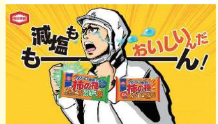
▲減塩商品のおいしさを知ってほしくて、PRイベントを実施したこともあるよ。

商品を作っても売れなければ意味がありません。手に取ってもらえるようにパッケージのデザインを工夫したり、宣伝用のイラストを考えたりしました。減塩商品はおいしくないというイメージを持たれることも多く、商品のおいしさをしっかりと伝えることがとても大切です。