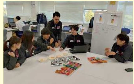
▲みんなで味見や情報収集をするなど、時間をかけてしっかり議論するよ。

でも社内からは、「おいしい商品を作れるのか?」、「減塩商品を買ってくれる人は少ないのではないか?」という反対の意見も多くありました。それでも、あきらめずに企画を続けました。