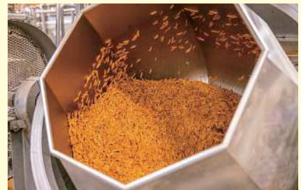
▲大きな鍋でせんべいに味をつけている様子。工場で効率よく作れるようにレシピ完成後も微調整を行うよ！

味つけレシピを50種類以上考えて、減塩商品の開発を行いました。何百回も試作と味見をくり返し、うま味を使うなど、色々な工夫をしてやっと完成しました。大きな工場で作っても味にばらつきが出ないように、材料や味つけから作り方まで、細かく調整をするため、開発には時間も手間もかかります。