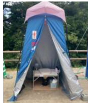
災害用マンホールトイレ