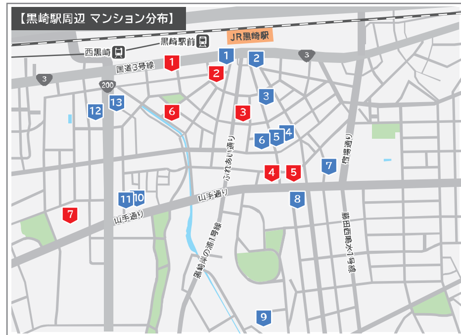
築5年以内・分譲、賃貸マンション