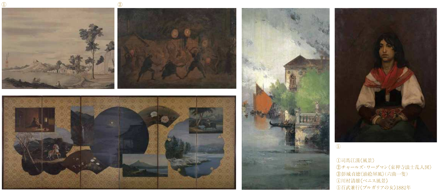
① 司馬江漢《風景》 ② チャールズ・ワグマン《東禅寺浪士乱入図》 ③ 彭城貞徳《油絵屏風》(六曲一隻) ④ 川村清雄《ベニス風景》 ⑤ 百武兼行《ブルガリアの女》1882年

スペシャル 「日本」近代洋画を超えていく画家たち 岸田劉生・佐伯祐三らの作品を特別出品