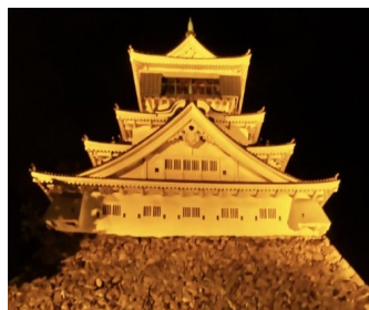
イエローライトアップ（イメージ）