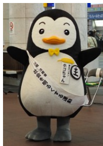
更生保護マスコットキャラクター 「ホゴちゃん」