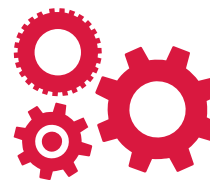
コンポーネント事業