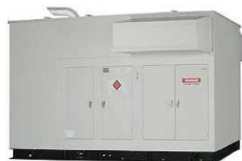
(ディーゼル・ガスタービン)