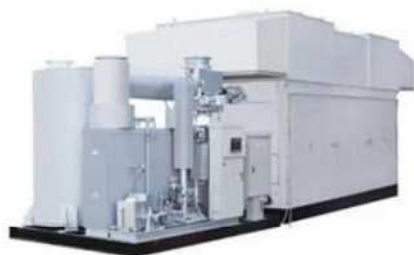
(都市ガス・バイオガス)