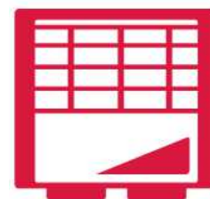
エネルギーシステム事業