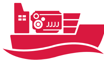
大型船用エンジン事業