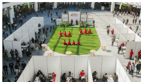
※会場のイメージ図