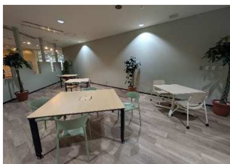
【新・こどもまちなかスペース】

より利用しやすく、より過ごしやすい空間にするため協議を重ね、(株)北九州輸入促進センター様のご協力により、場所を移転し、リニューアルオープンしました。