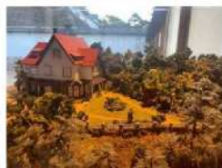
櫓山荘の模型(小倉城庭園)