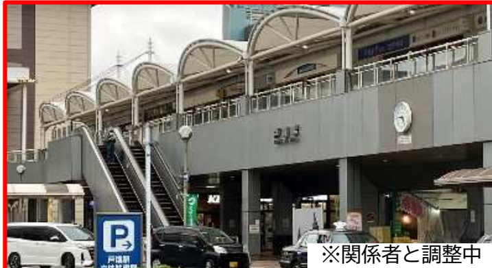
②改札前 2基 →エスカレーター撤去・階段設置 ※関係者と調整中