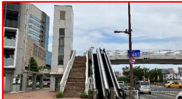
⑤汐井町 2基 →エスカレーター撤去