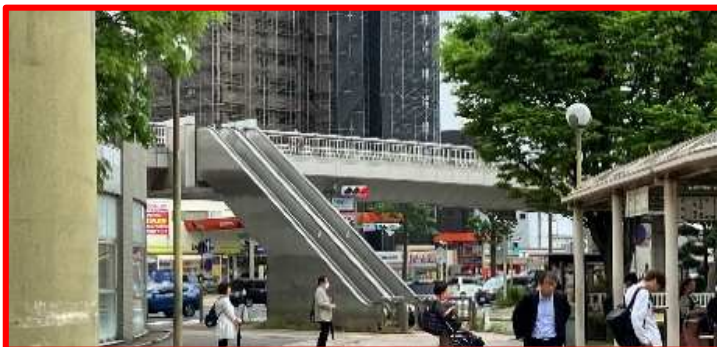
③福銀前 2基 →エスカレーター撤去・階段設置