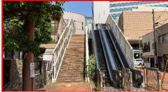
④中本町 2基 →エスカレーター撤去