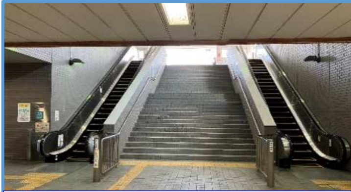
①南北公共連絡通路 4基 →当面維持