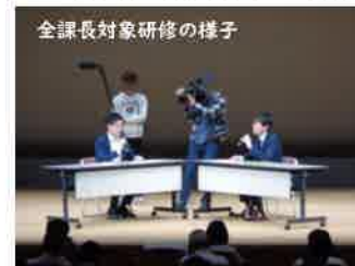
全課長対象研修の様子