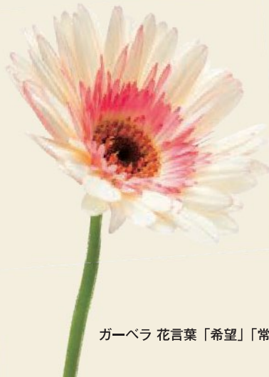
ガーベラ 花言葉「希望」「常に前進」

映画だって、小説だって、 物語がおもしろくなってくるのは後半から。 人生だって同じです。これからワクワクする展開に！ 年長者研修大学校は、北九州市在住の60歳以上の方々が入学でき、 生きがいや健康づくり、社会参加できる知識や技能を学ぶ場所。 これまで出会うことのなかった仲間たちも待っています。 今という時代にふれながら、 一步一步成長していける1年間。 さあ、もう一度、 あなたらしい学生時代を謳歌しませんか？