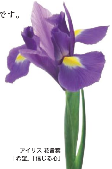
アイリス 花言葉 「希望」「信じる心」