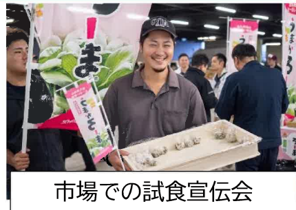
市場での試食宣伝会