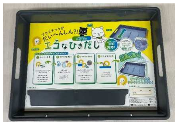
プラリーボックス