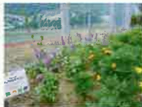
九州共立大学 ちょボラ部(新人賞)