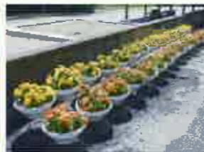
九州国際大学(新人賞)