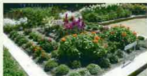
企救一公園愛護会(優良賞)