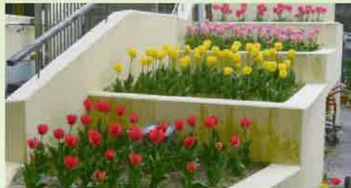
高見の森保育園(ひまわり賞)