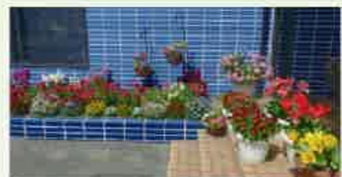
株式会社 網中(優良賞)