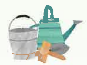
北九州健康友の会 小倉西支部(新人賞)