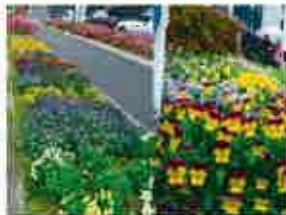
北九州市立 小瀬児童館(新人賞)