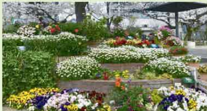
金田第一町内会(北九州市「花の匠」)