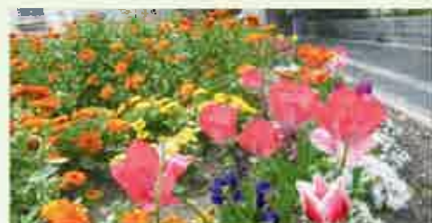
西小倉花壇整備部会(優秀賞)