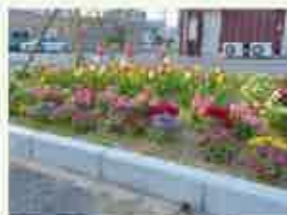
社会福祉法人 もやい聖友会(特別賞)