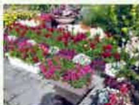
守恒校区庭づくり委員会(特別賞)