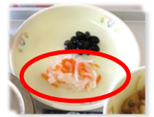
給食の紅白なます

紅白なますの赤と白は、日本のお祝い事に使われる紅白の水引きを表しています。2色の組み合わせで今年1年の健康や家内安全など幸運を祈る意味があります