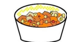
にくとまめのにこみ (フェジョアーダ)