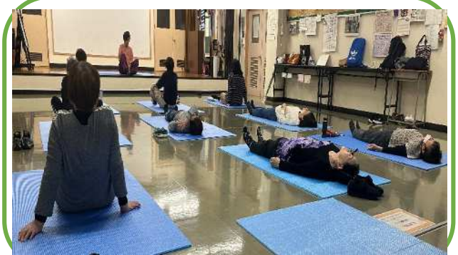
【気の波動に包まれ身体が気持ちいい♡】