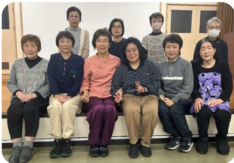
【先生と受講生の皆さん】