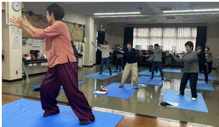
【ゆっくりとした動作で身体を動かし、呼吸をします。】