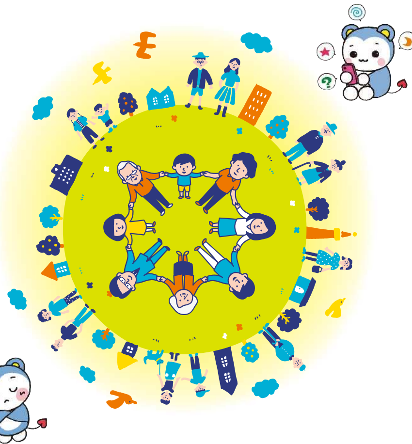
人権の約束事運動マスコットキャラクター「モモマルくん」