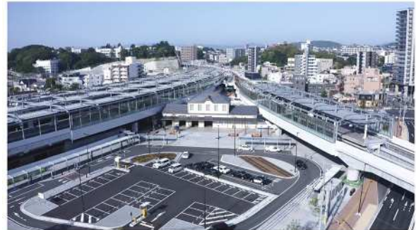
▲折尾駅北側駅前広場