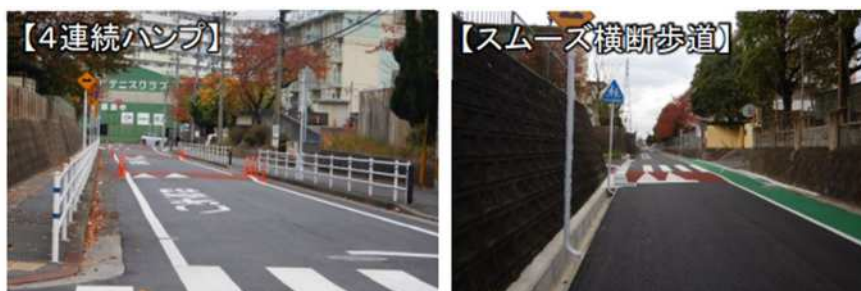
▲対策箇所(医生ヶ丘・千代ヶ崎地区)

北九州市八幡西区 医生ヶ丘・千代ヶ崎地区は、令和3年11月に、「4連続ハンプ」、「スムーズ横断歩道」の2つの物理的デバイスが設置され、令和4年にゾーン30プラスに登録されました。平日の通学時間帯のみならず、平日・休日の昼間12時間でも速度抑制の状況が把握されており、「4連続ハンプ」、「スムーズ横断歩道」ともに対策の効果がみられました。