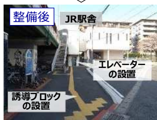
▲主要駅周辺のバリアフリー化 (JR安部山公園駅)