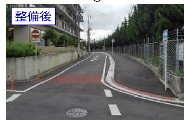
▲歩道のバリアフリー化 (一枝21号線)