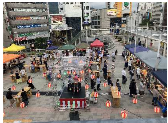
▲黒崎駅ペDESTリアンデッキ（八幡西区） 駅前広場を活用したにぎわいづくり