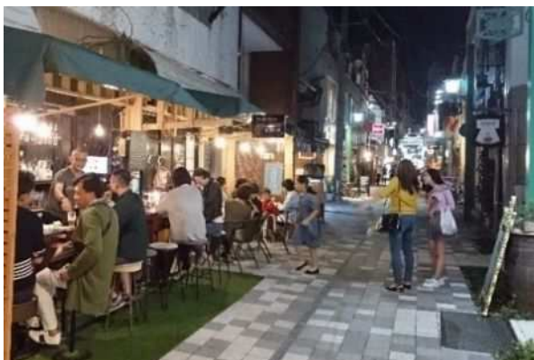
▲魚町11号線（小倉北区） 道路を活用したにぎわいづくり