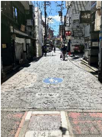
▲鍛冶町1号線（鷗外通り） 繁華街の雰囲気づくりに資する道路整備