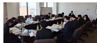
▲懇談会の実施状況