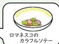
ロマネスコのカラフルソテー