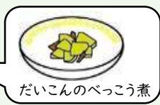
だいこんのべっこう煮