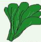
【大葉春菊(うまかろうま)】