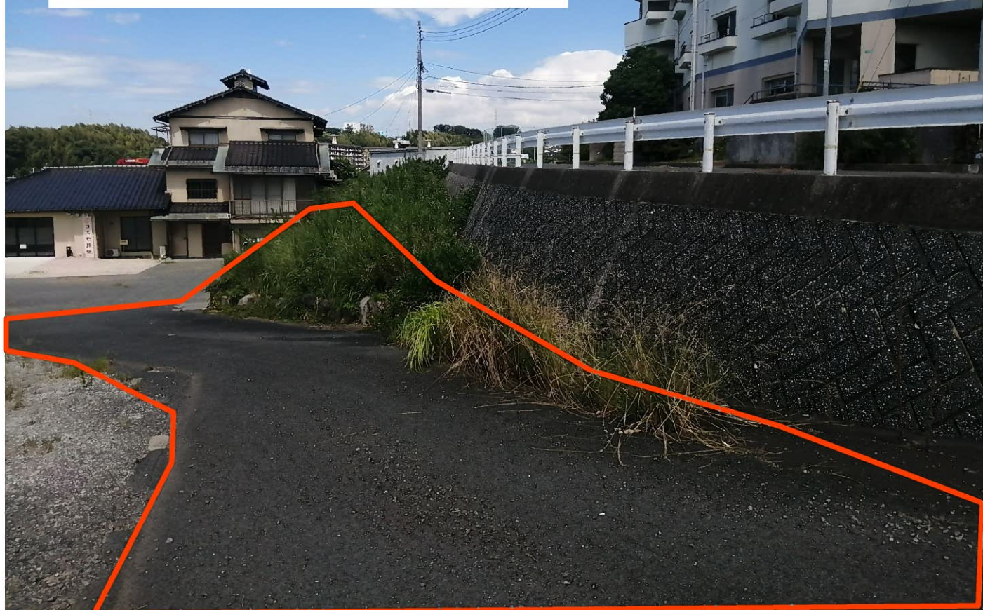
現地写真①（南から撮影）