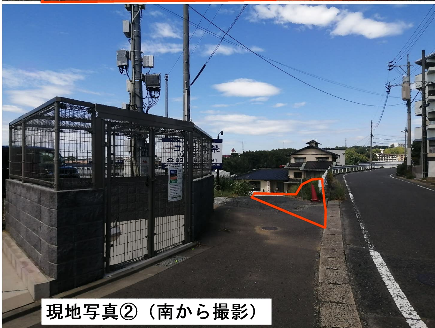
現地写真②（南から撮影）