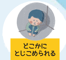
どこかに とじこめられる