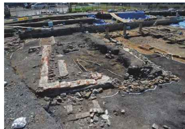
3号建物全景 (北から)