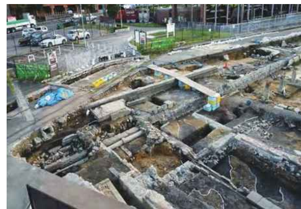
5号建物と周辺の遺構群 (北東から)