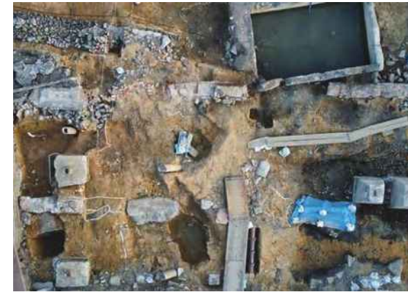
6号建物検出状況 (上が南東)

おり、ここに間知石の跡形が残っている。このことから、4号と同様に上部に石垣が構築されていたことがわかる。