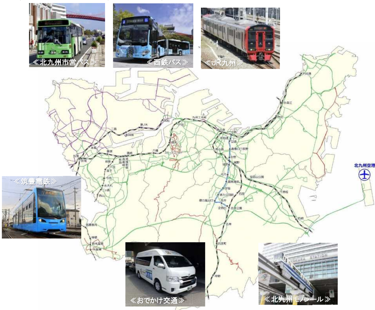
《北九州市内の公共交通マップ》

公共交通の特徴は、都市部と郊外部の移動を担う北九州モノレールや筑豊電鉄、公共交通空白地域の交通を担う「おでかけ交通」が挙げられ、公共交通が市域全体に網羅されており、効率的に移動できる環境にあります。