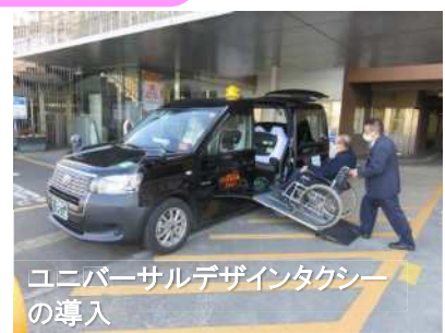
ユニバーサルデザインタクシーの導入