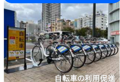
自転車の利用促進