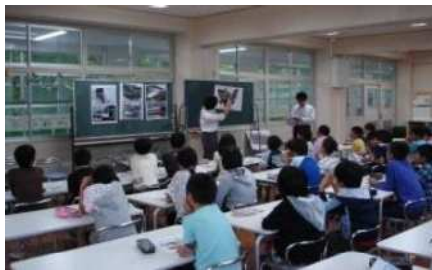
学校モビリティマネジメント(H28～R2) 計15校(約600人)