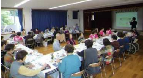
高齢者モビリティマネジメント(H29～R2) 計52箇所(約2,200人)