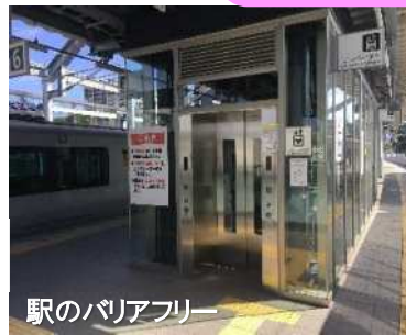
駅のバリアフリー