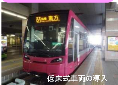
低床式車両の導入