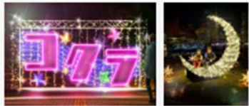
〈フォトスポット・イメージ〉

◀ 紫川周辺に 新たな3つのフォトスポットが出現! 音に反応して流れる光や、星空の中に滞在しているかのような世界観など、小倉イルミネーションならではの空間を演出します。