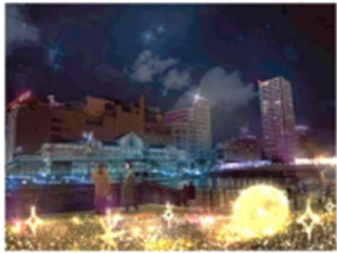
〈紫川河畔(東側)・イメージ〉