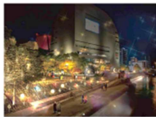
〈紫川河畔(西側)・イメージ〉