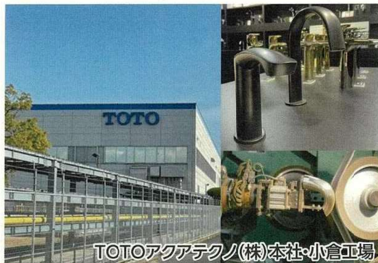
TOTOアクアテクノ(株)本社・小倉工場

TOTOの工場で最新商品と水栓金具のものづくり現場(工場)に潜入!今大人気のスイーツショップが並ぶスイーツロードで絶品スイーツを満喫!途中の曾根干潟からは瀬戸内海が一望できます。