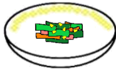
ほうれんそうの いためもの