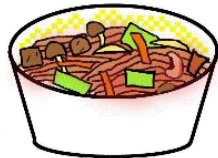
のおがたやきスパ