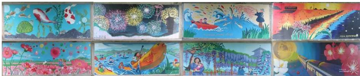
【芝谷橋の橋脚壁画】