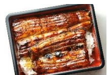
うなぎのかば焼き