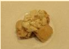
チキンのやさいたタルタルソース