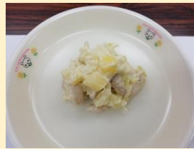
チキンのやさいたタルタルソース