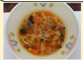
シェフのミネストローネ