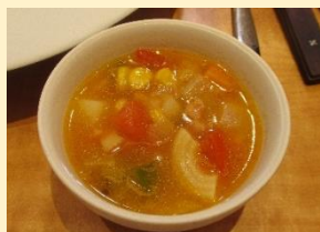
シェフのミネストローネ