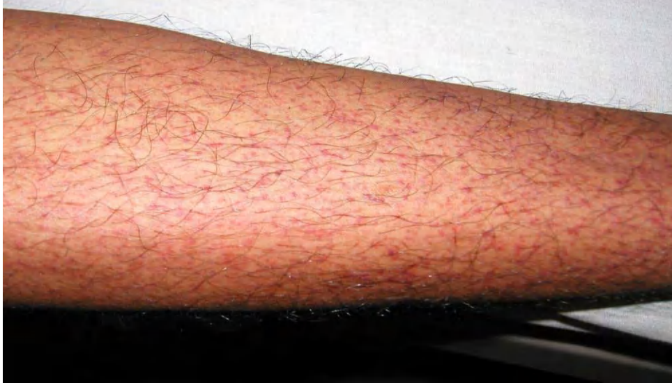
図 1. デング熱患者の発疹：解熱時期にみられた点状出血