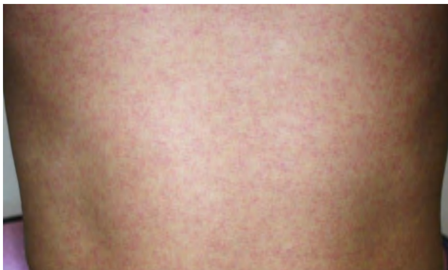
図3. ジカウイルス病の斑状丘疹様の発疹

潜伏期間は、2～12日（多くは2～7日）である。ジカウイルス病の臨床症状は多彩であるが、斑状丘疹様の発疹（ 図3 ）は90～100%に認められるのに対して、発熱の頻度は35～65%とされている 29,47 。また発疹は掻痒感を伴うことが多いとされている。また、大半の症例は入院を必要としなかった。 表7 に2015年のブラジル・リオデジャネイロにおけるジカウイルス病患者が発症後4日以内に認めた臨床症状を示す 47 。