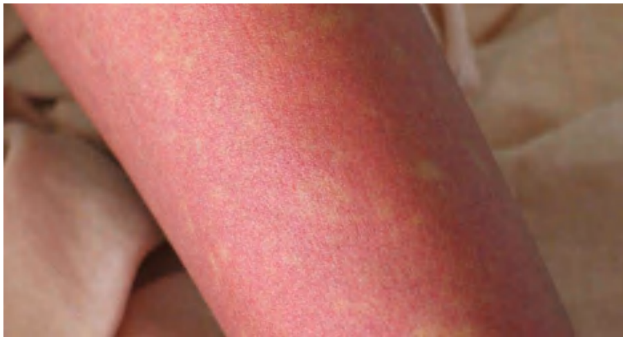
図 2. デング熱患者の発疹：解熱時期にみられた島状に白く抜ける紅斑