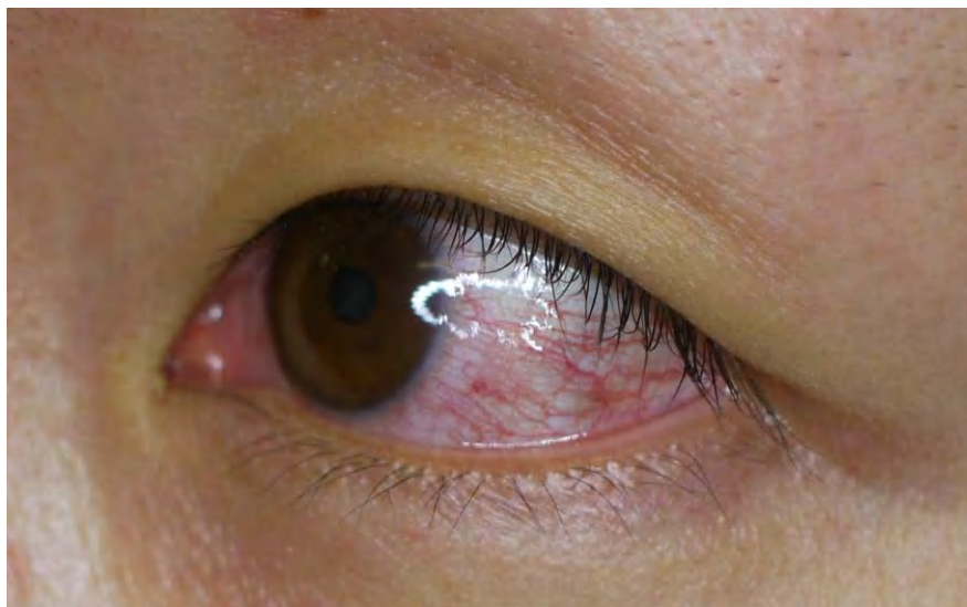
図4. ジカウイルス病の充血性結膜炎