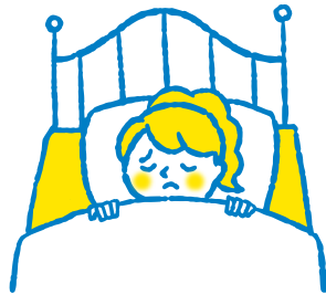
からだ体がだるい Tiredness