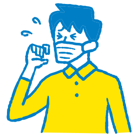
せき・たんがで出る Cough, Phlegm