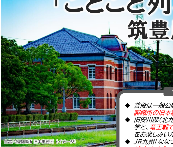
官営八幡製鐵所 旧本事務所 (イメージ)