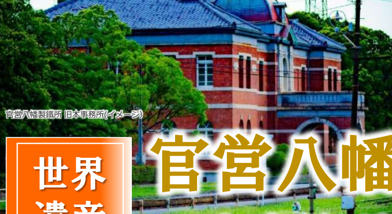
官営八幡製鐵所 旧本事務所(イメージ)