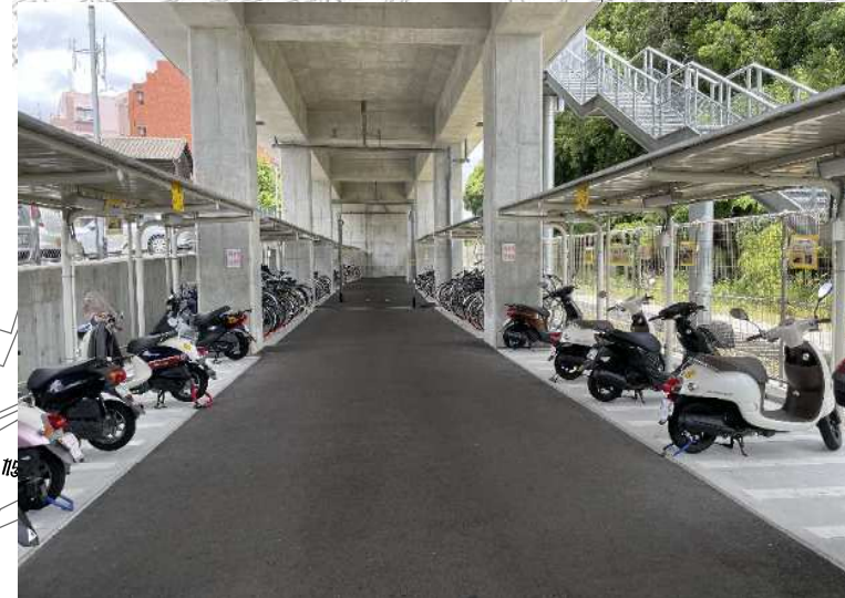
八幡西区折尾二丁目