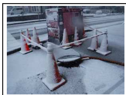
仮設ポンプを設置した応急対応