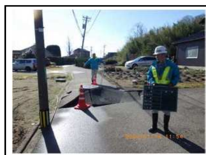
下水道の破損に伴う道路陥没