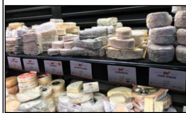
たくさんの種類のチーズ

2023年、フランス人の平均寿命は82.5歳で、世界第11位でした。日本食と同じように多種の食材を食べることがフランス人の長寿の秘訣です。特にチーズは、フランスの食卓には欠かせない食材です。種類が豊富で1200~2380種類もあると言われており、チーズを専門に作るチーズ熟成士という職人もいます。発酵食品のチーズは、腸内環境をよくするほかに、