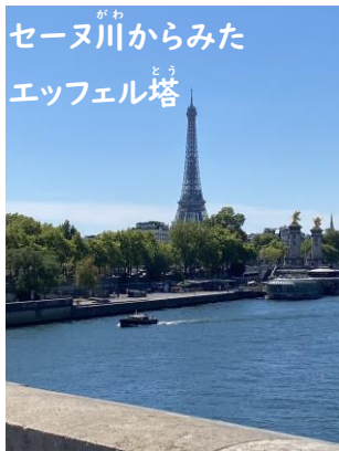
セーヌ川からみた エッフェル塔

今回から、4つの新競技が追加され、32競技329種目が実施される「パリオリンピック」は、7月26日から8月11日まで、フランス・パリで開催されます。