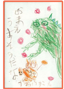
「おまえうまそうだな」 作 宮西達也