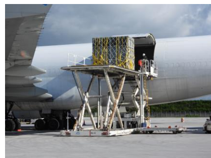
ゾウが入った檻を機材から降ろす様子