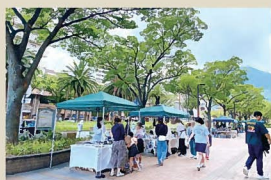
15 ケヤキテラス八幡 八幡駅前地区を活動領域とし、清輝、マルシェ、朝明、学生とのコラボ等を通じて地区の景観を豊かにする。2005年から活動開始。