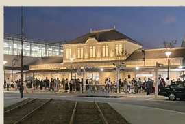
17 折尾駅 大正5年当時の駅舎の外観が可能な限り再現された。また照明デザインが施され、駅周辺の夜間景観の創出に寄与している。