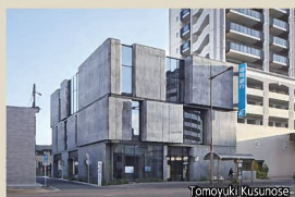
10 福岡銀行南小倉支店 太陽光による熱負荷を抑える工夫を、独自の重厚な外観デザインへと発展させ、都市建築としての風格ある表情を創り出している。