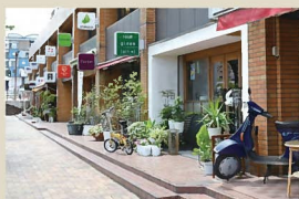
4 飲食店等の街並み空間 小倉北区大手町三丁目の歴史を感じさせる建物。大きな街路樹と開かれた通りの店舗群が合わり、洒落た雰囲気を感じている。