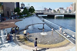
11 紫川河畔 紫川河畔は第3回北九州市都市景観賞を受賞。今回は、その後整備された、河川区域の一部を利用した親水空間である。