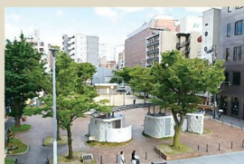
9 米町公園 老朽化した公園を住民とのワークショップにより、トイレの前面配置や多くの既存樹を保全し、新たな憩いの場を実現した。