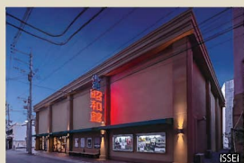
6 小倉昭和館 旦過地区火災からの再建を成し遂げ、かつての昭和館のイメージを踏襲することで小倉の文化的景観の継承に貢献している。