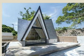
16 永源寺 観音堂 スケール感を抑えた特徴的な佇まいが、木屐淵の歴史漂う住宅街に人と向き合う穏やかな場を創出している。