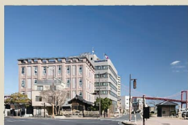
13 第一港運本社ビル 歴史的な意匠と素材使いにより、大正時代の建築が多く点在する香松南海岸通りの景観形成に貢献している。