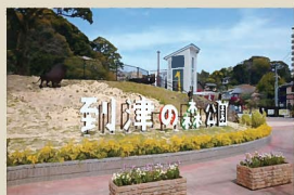
3 到津の森ゲートサイン 郷土の森を背景に、キリンエレベーター、大階段、大屋根等、遊び心のあるシンボリックなゲートサインとしてリニューアルされた。