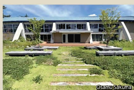
20 九州工業大学 GYMLABO [ジムラボ] 老朽化した体育館を開放的なワークスペースへと改修することで、緑豊かなキャンパスに新たな学びの風景を創出している。