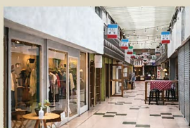
19 寿通り商店街 シャッター街化した黒崎の小さな商店街「寿通りに、地域に関わる人や新たな建物の使い方を増やす取組みを通じてリノベーションし続けている。