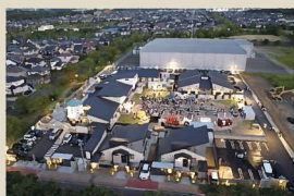
12 児童養護施設 暁の鐘学園 暁の郷 建物のボリューム感を抑えつつ緑地帯を確保することで、周辺の良好な街並みと調和した親しみやすい景観を創出している。