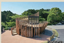
14 HIBIKINADA CAMP BASE 管理棟 間伐材を用いた特徴的な形態が、緑豊かな環境を美しく増進する創出するとともに、自然と親しむ拠点の新たなシンボルとなっている。