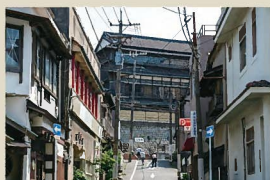
2 三宜楼坂から見上げる三宜楼 門司港が繁栄した1931年建造、2014年に保存修理工の後、飲食店が入る。坂の下から見上げ、また登るにつれ印象的な姿が展開する。