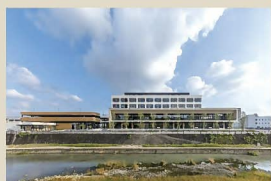
8 小倉第一病院 川に向かって高さを抑えた断面構成、幅広の屋外テラスと深い庇や、高木の並木や夜間照明が、坂道に沿って良質な景観を創出している。