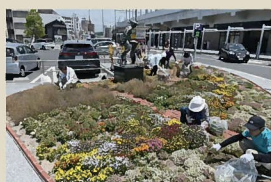
18 折尾コミュニティガーデン 折尾駅前広場を活動場所とし、学生主体の組織が婦人会等とも協力して、駅前色彩のある景観をつくっている。2023年活動開始。