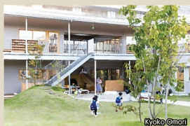
5 貴船保育園 緑豊かな庭園と豊富な半外空間により、重苦しくしがちな高架下に温かな着わいの感じられる風景を創り出している。