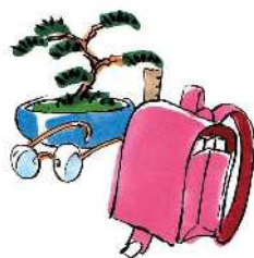
■高齢者や児童の福祉 保健医療などの充実