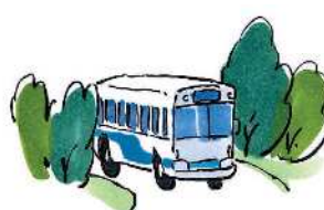
■水道、交通などの 公営企業の経営