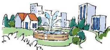
■住宅、公園、道路、港湾、空港 などの建設・管理