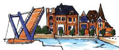
■地域経済の振興や 門司港レトロ地区などの観光の振興