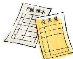
■戸籍、住民登録といった 市民サービスの実施