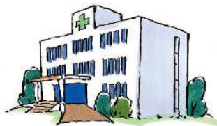
■病院、急患センター などの運営・管理