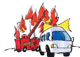
■消防、救急活動などの 市民の安全・安心対策