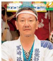
令和6年度 当番山笠実行委員長 熊手一番山笠