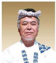
黒崎祇園山笠保存会 会長

黒崎祇園山笠は、春日神社、岡田宮、一宮神社の氏子によって およそ四百年前から行われており、県の無形民俗文化財に指定されています。 お潮井取りには山笠の原型といわれる笹山笠が出ます。 その後笹山笠は人形飾山に衣替えし、勇壮華麗な祭りを繰り広げます。 旧来、「黒崎祇園山笠」は喧嘩山笠ともいわれ、 車輪を軸に曳き廻す様は見る者の血を沸かせます。