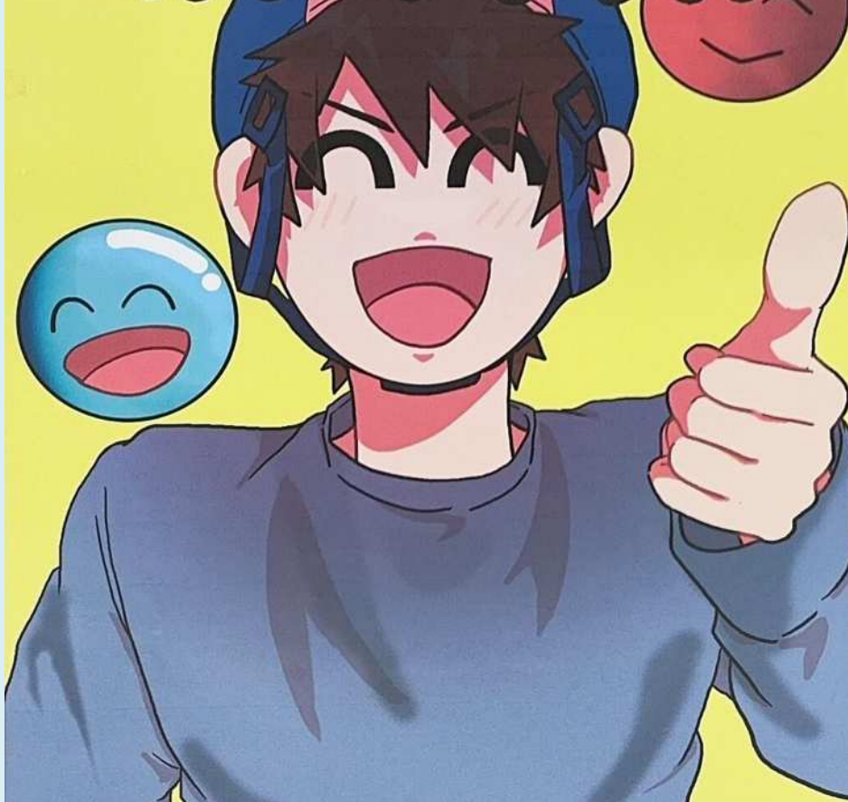
高校生自転車ヘルメット着用促進動画・ポスターコンクール優良賞